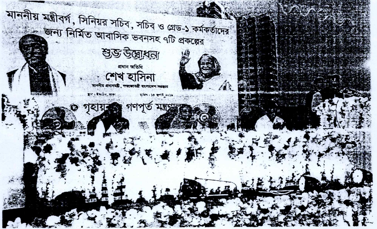
চিত্র: মন্ত্রীবর্গ, সিনিয়র সচিব, সচিব ও গ্রেড-১ কর্মকর্তাদের জন্য নির্মিত আবাসিক ভবনসহ ৭টি প্রকল্পের শুভ উদ্বোধন করেন মাননীয় প্রধানমন্ত্রী।

(১) ঢাকার ইস্কাটনে সিনিয়র সচিব, সচিব ও গ্রেড-১ কর্মকর্তাদের জন্য ০৩টি ২০তলা ভবনে ১১৪টি ফ্ল্যাট নির্মাণ প্রকল্প, ঢাকার বেইলী রোডে মাননীয় মন্ত্রীবর্গের জন্য ১০টি আবাসিক ফ্ল্যাট নির্মাণ, ঢাকাস্থ মিরপুর ৬নং সেকশনে সরকারি কর্মকর্তা-কর্মচারীদের জন্য ৭৩৬টি ফ্ল্যাট নির্মাণ, ঢাকাস্থ মিরপুর পাইকপাড়ায় সরকারি কর্মকর্তা-কর্মচারীদের জন্য ৪১৬টি ফ্ল্যাট নির্মাণ, ঢাকাস্থ লালমাটিয়া নিউকলোনীতে সরকারি কর্মকর্তাদের জন্য ১৫৩টি ফ্ল্যাট নির্মাণ, ঢাকাস্থ লালমাটিয়া নিউকলোনীতে ০৭টি জরাজীর্ণ ভবনের স্থলে ১৩০টি আবাসিক ফ্ল্যাট নির্মাণ এবং বেগুনবাড়ী খালসহ হাতিরঝিল এলাকার সমন্বিত উন্নয়ন প্রকল্পে ক্ষতিগ্রস্ত ভবন মালিকদের পুনর্বাসন ও বিক্রয়ের লক্ষ্যে এপার্টমেন্ট নির্মাণ শীর্ষক প্রকল্প। মোট ০৭টি প্রকল্পের আওতায় ১,৬৭১টি ফ্ল্যাট ১৫ জুলাই ২০১৯ তারিখে মাননীয় প্রধানমন্ত্রী কর্তৃক শুভ উদ্বোধন করা হয়।